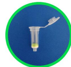
Plant DNA Column