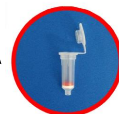
Plant RNA Column