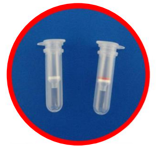
< 左;Filter Column 右;FARB Column >