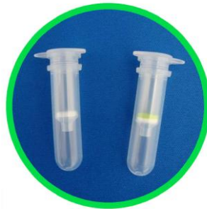
< 左;Filter Column 右;FAPG Column >