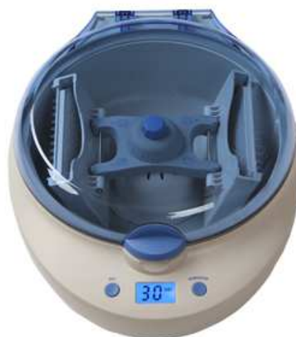
プレート用アダプター/0.2mlPCRチューブ用アダプター 付属